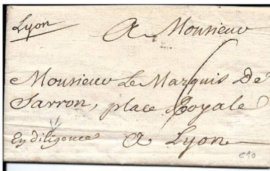
Au tarif de 1704 -6 Sols

Vers 1700 l'endroit devient place royale .