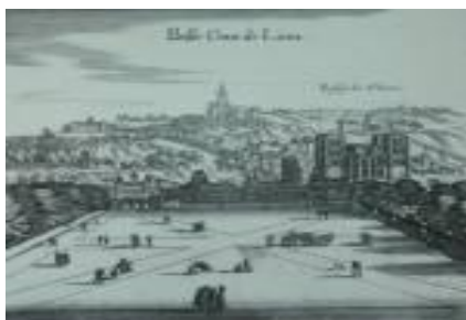
la place en 1657

En 1604 Henri IV pousse le conseil de la ville à acquérir le pré afin d'y aménager une place d'arme, le pré est alors défriché pour accueillir les cérémonies militaires, cette opération est progressive et sur un plan de 1626 la place est encore représentée comme terrain libre.